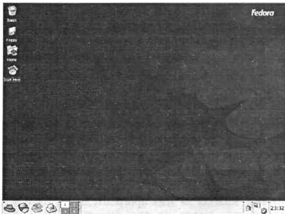
Рис. 1. Графический рабочий стол Fedora